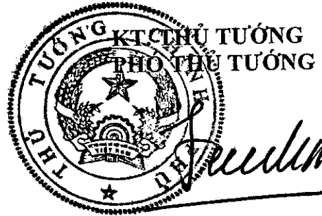
Lê Minh Khái